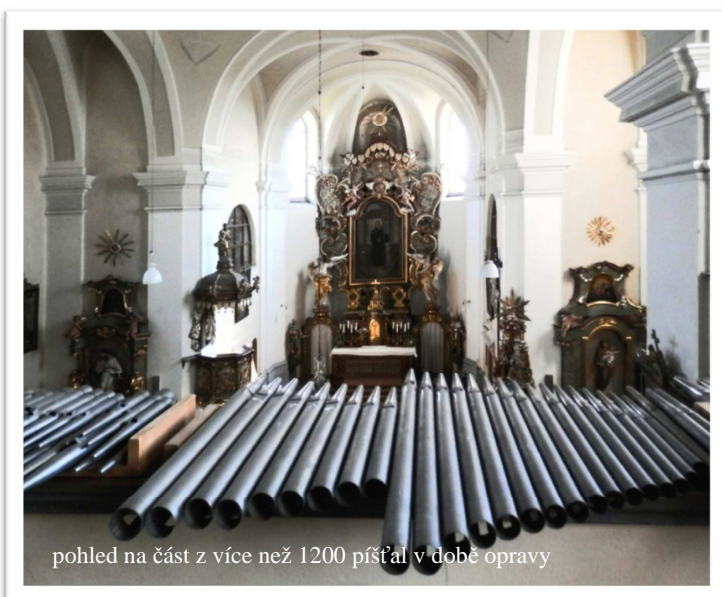
pohled na část z více než 1200 píšťál v době opravy